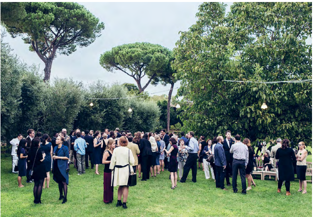
From top: Villa Aurelia, an artist's studio at AAR, and a garden party at AAR.